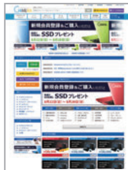
ネットショップのデザイン