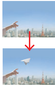
写真の修正や合成