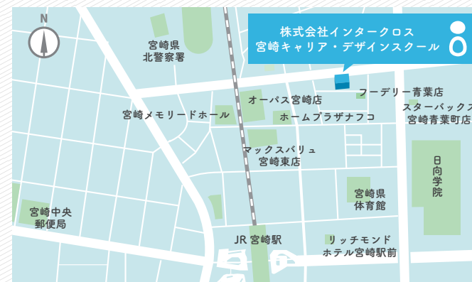
訓練実施場所・選考場所：株式会社インタークロス(宮崎キャリア・デザインスクール) 〒880-0879 宮崎県宮崎市宮崎駅東三丁目7番地1